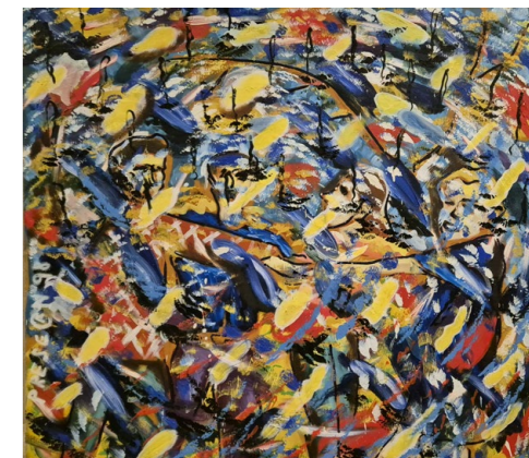
Claudiu Presecan *1969, lebt und arbeitet im rumänischen Cluj-Napoca, nahm 1999 an einer Gruppenausstellung in der Galerie Gartenflügel in Ziegelbrücke teil, u.a. mit dem Werk «Dans» [Tanz]. www.claudiupresecan.com