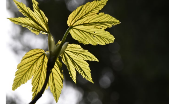
Verena Lüscher *1947, Sarons-Schwester, Primarlehrerin und Heilpädagogin. Hält seit 40 Jahren ihre Entdeckungen in der Schöpfung fotografisch fest. Im grossen Saal des BGZ dokumentiert sie vierteljährlich die Jahreszeiten.