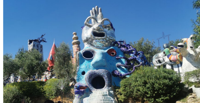
Niki de Saint Phalle (1930 – 2002), französisch-schweizerische Malerin und Bildhauerin, bekannt durch ihre Nana-Figuren (z.B. Engel im HB Zürich) und die Kooperationen mit Jean Tinguely. Der Morteratsch-Gletscher inspirierte sie zur Realisierung des Tarotgartens in der Toscana, u.a. mit einer Kapelle mit Schwarzer Madonna.